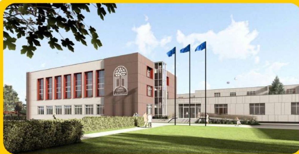
Telšių „Džiugo“ gimnazija