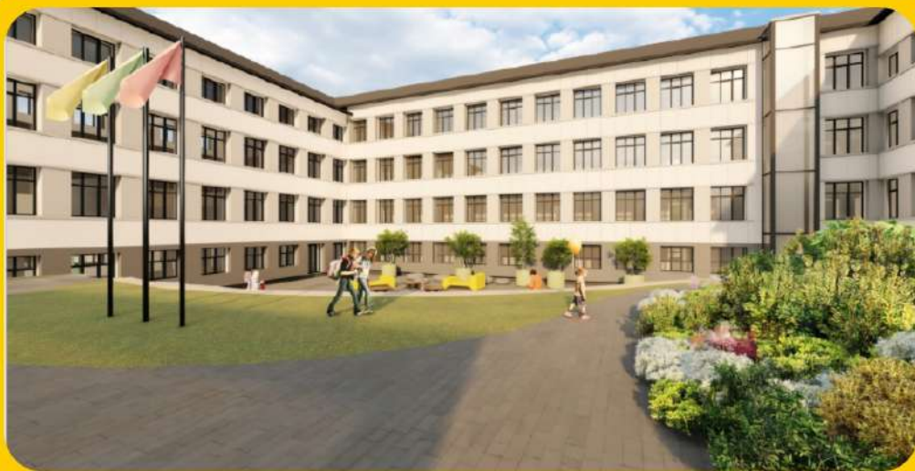
Telšių „Germanto“ progimnazija