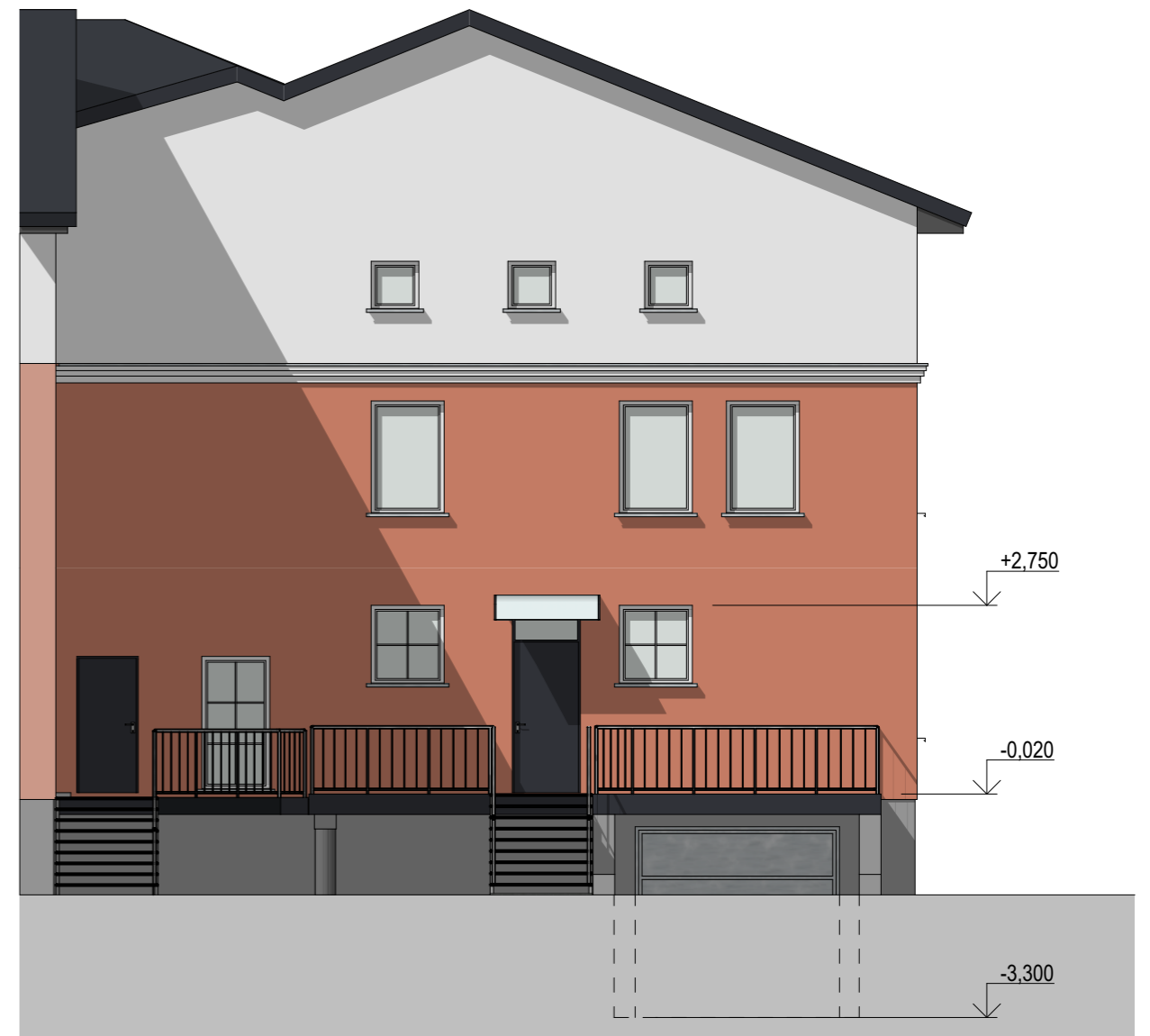
Pietryčių fasadas (po remonto)