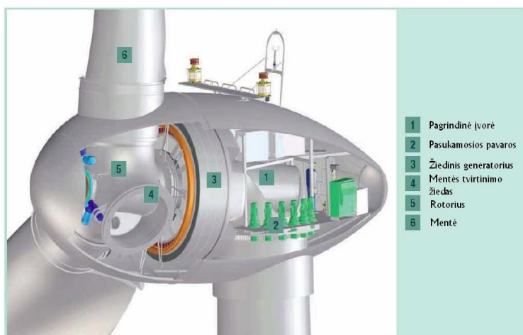
2 pav. Gondola

Gondoloje (2 pav.) yra patalpinti visi vėjo elektrinės mechanizmai, kurie rotacinę energiją paverčia elektros energija.